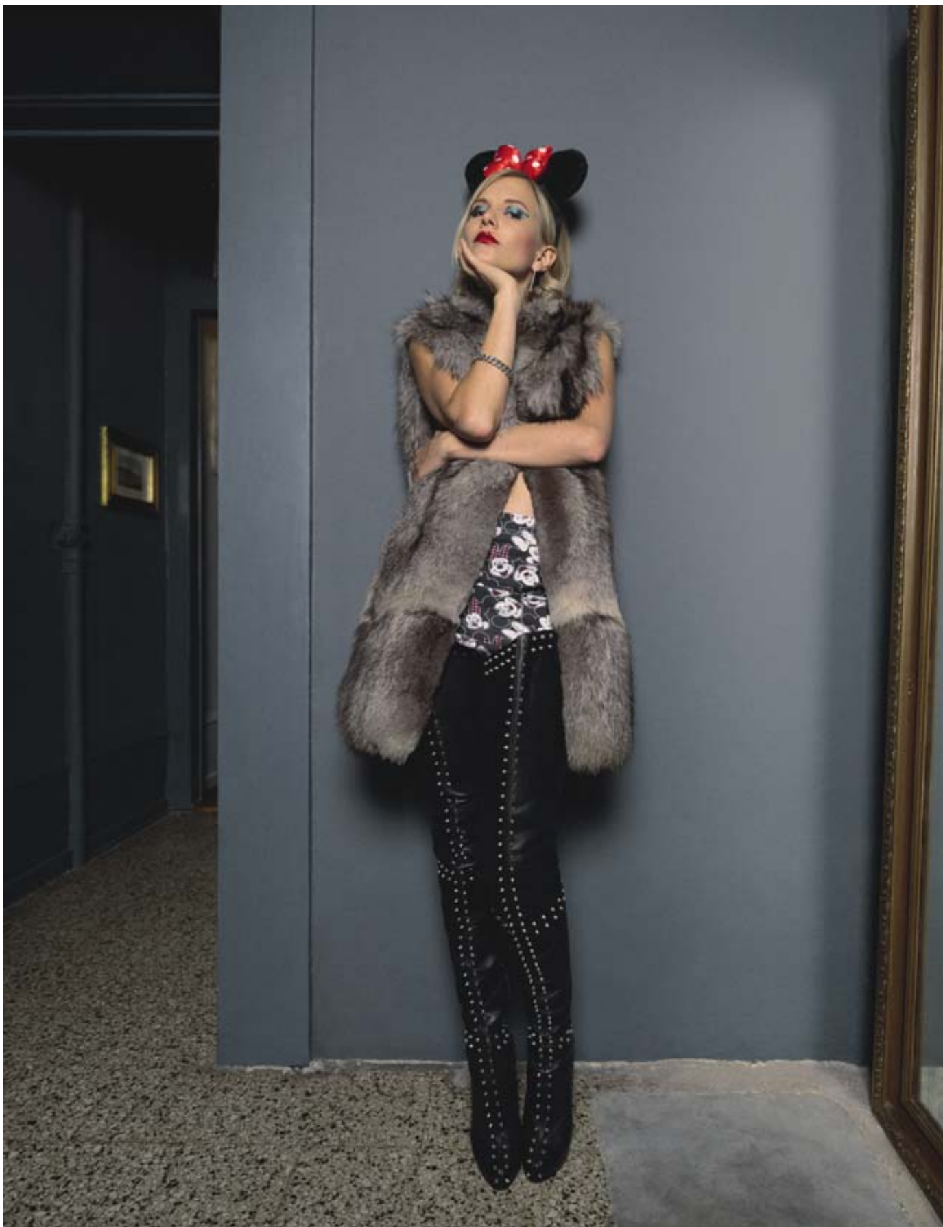
> Gilet en renard argenté rasé Adrian Reber, jupe Minnie Mouse (Maniak Lausanne), cuissardes Christian Louboutin (propriété de la make-up artist), serre-tête Minnie Mouse (propriété du styliste), boucles d'oreilles Capucine Parel, bracelet (propriété de la make-up artist).